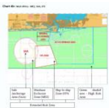
Карта 4В: Западная Африка – Зоны MEZ, SAA и STS