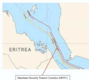
Chart 3: Maritime Security Transit Corridor (MSTC) in the Red Sea and the Bab al-Mandeb Straits

(Vessels transiting within the MSTC are in Extended Risk Zone, NOT Warlike Area or High Risk Area)