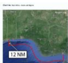
Карта 4А: Западная Африка – Бенин и Нигерия

Зона повышенного риска IBF включает расположенные в территориальных водах Бенина и Нигерии порты, терминалы и якорные стоянки, дельту реки Нигер, другие внутренние водные пути и портовые сооружения, за исключением случаев, когда судно пришвартовано к точечному причалу (Single-Buoy Mooring, SBM) в охраняемой зоне порта.