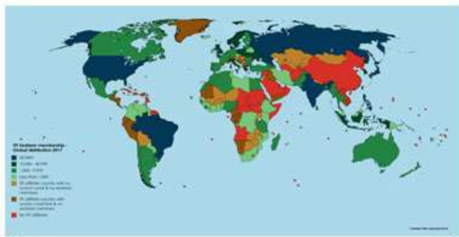
Членство моряков ITF – глобальное распределение, 2017

Согласно данным на 1 апреля 2017 года, моряки представляют 17,4 % от общего членства Международной федерации транспортников: членство моряков, декларируемое 218 членскими организациями ITF, составляет 892 119 моряков.