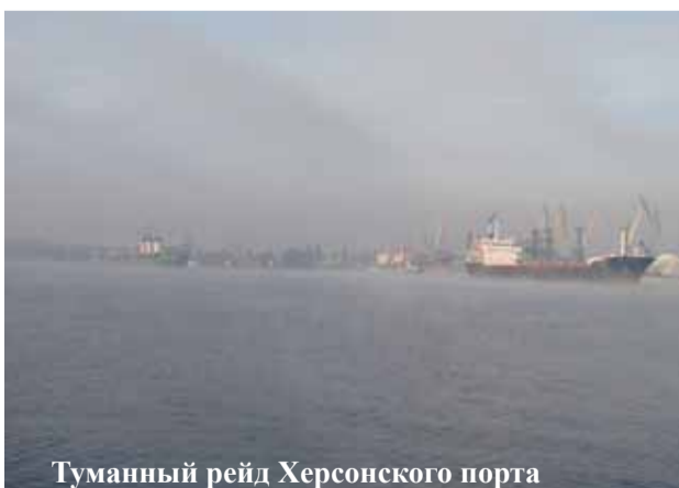
Туманный рейд Херсонского порта