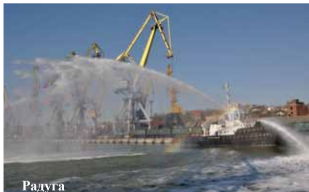
Радуга Автор: Наталья Серкутан