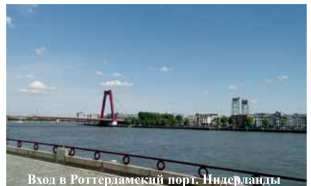
Вход в Роттердамский порт, Нидерланды