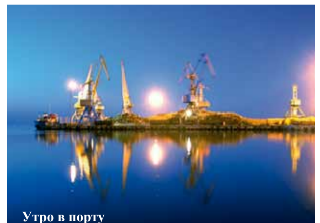
Утро в порту

МОРЯКЪ УКРАИНСКАЯ ПРОФСОЮЗНАЯ ТРАНСПОРТНАЯ ГАЗЕТА