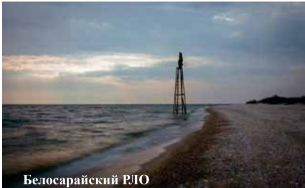
Белосарайский РЛО Автор: Максим Сагайдак