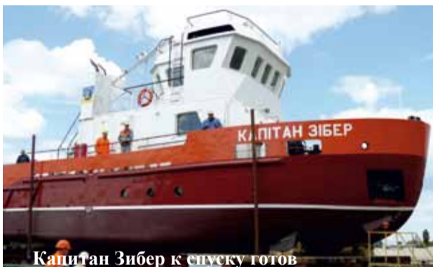
Капитан Зибер к спуску готов Автор: Евгения Рутьян