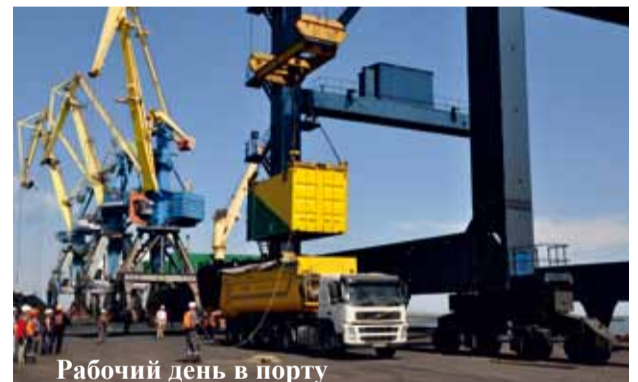
Рабочий день в порту