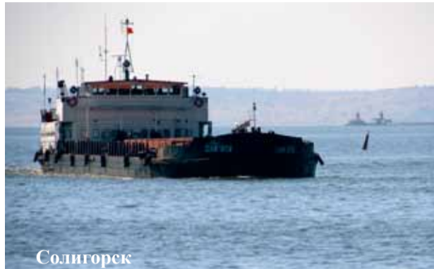
Солигорск Автор: Максим Сагайдак