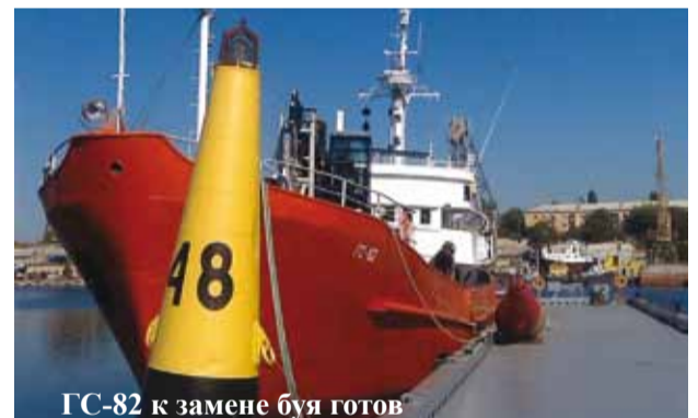
ГС-82 к замене буя готов