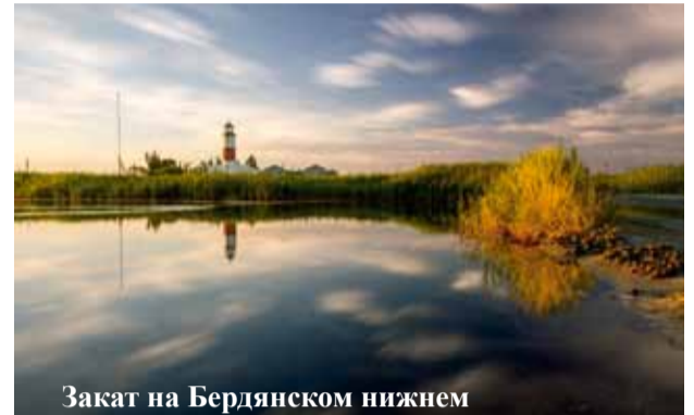
Закат на Бердянском нижнем