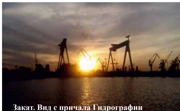
Закат. Вид с причала Гидрографии