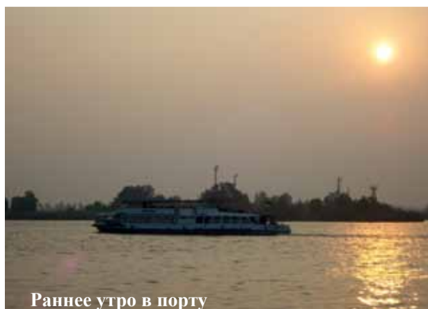
Раннее утро в порту