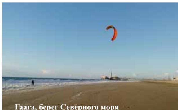
Гаага, берег Северного моря