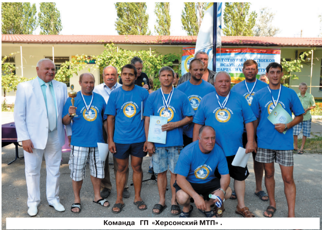
Команда ГП «Херсонский МТП» .

вые. Среди нововведений – портовое троеборье, водный туризм, рыбалка и метание легости.