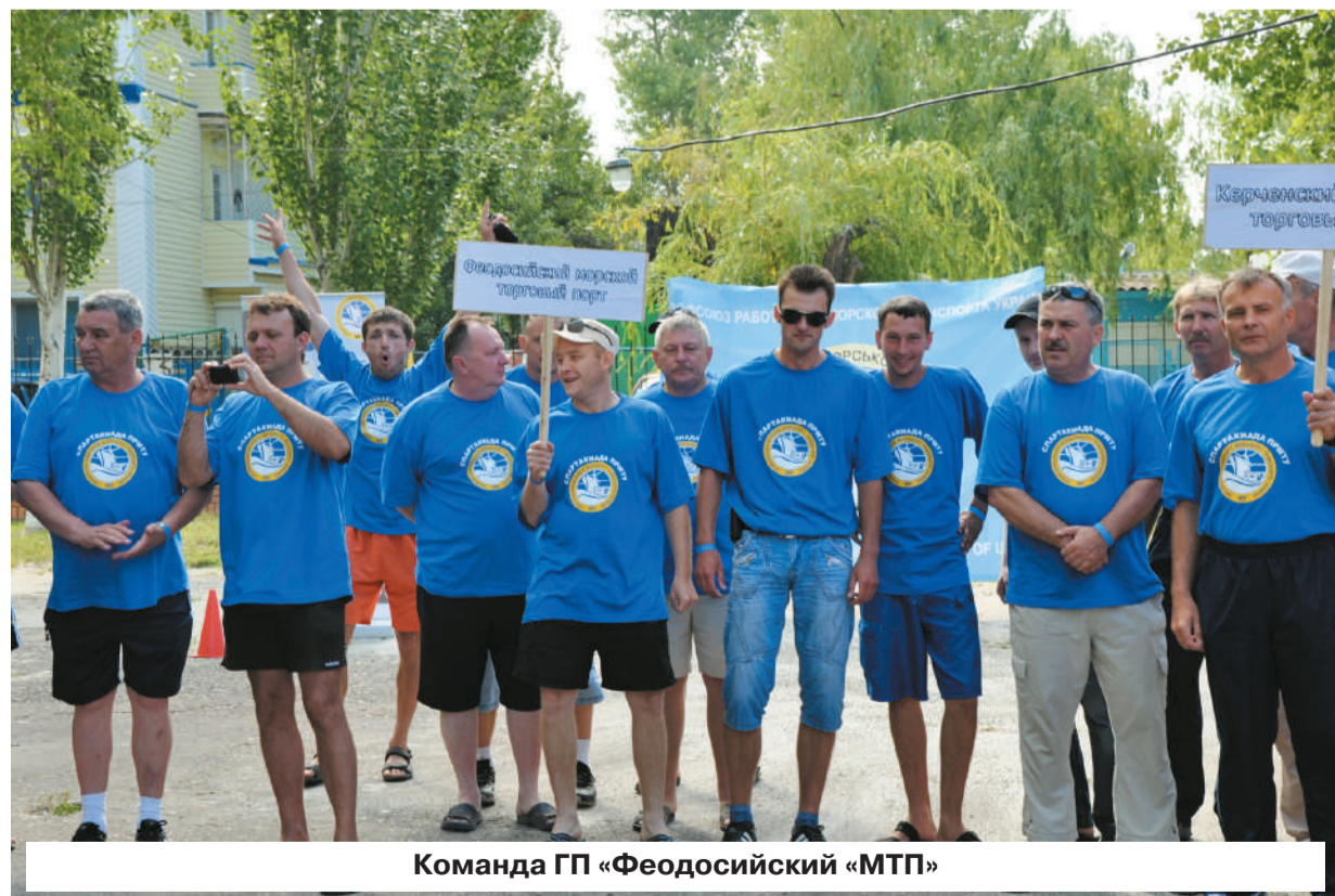
Команда ГП «Феодосийский МТП»