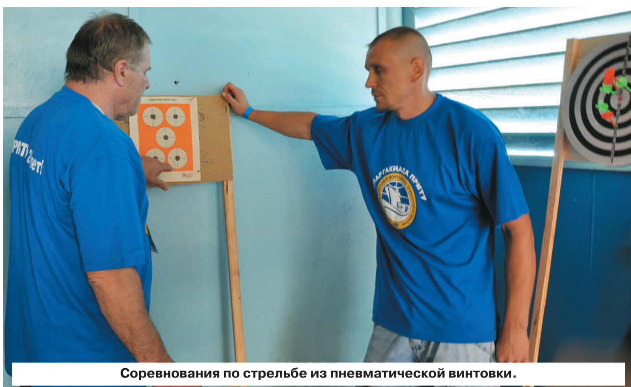
Соревнования по стрельбе из пневматической винтовки.

- Так может рассуждать человек, далекий от спортивной жизни коллектива. Чтобы попасть на спартакиаду ПРМТУ, надо не оставаться в стороне от спортивной жизни родного коллектива. Каждый порт проводит свои соревнования, а уж победители представляют предприятие на отраслевом уровне. В этом году наш порт делегировал на спартакиаду ПРМТУ 10 человек. Среди них – докеры-механизаторы, представители портофлота, разных служб и отделов. Хорошо, когда руководители предприятий не жалеют средств на укрепление