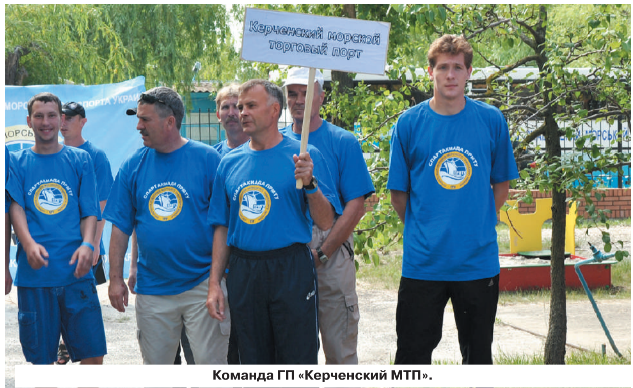
Команда ГП «Керченский МТП».