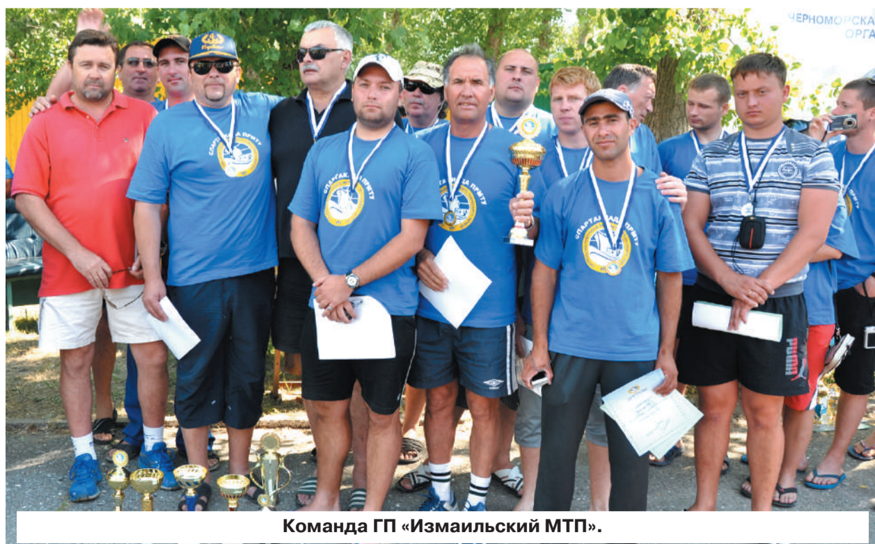
Команда ГП «Измаильский МТП».