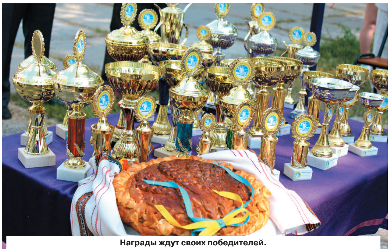
Награды ждут своих победителей.

- Я участвую в спартакиадах ПРМТУ уже не в пер-