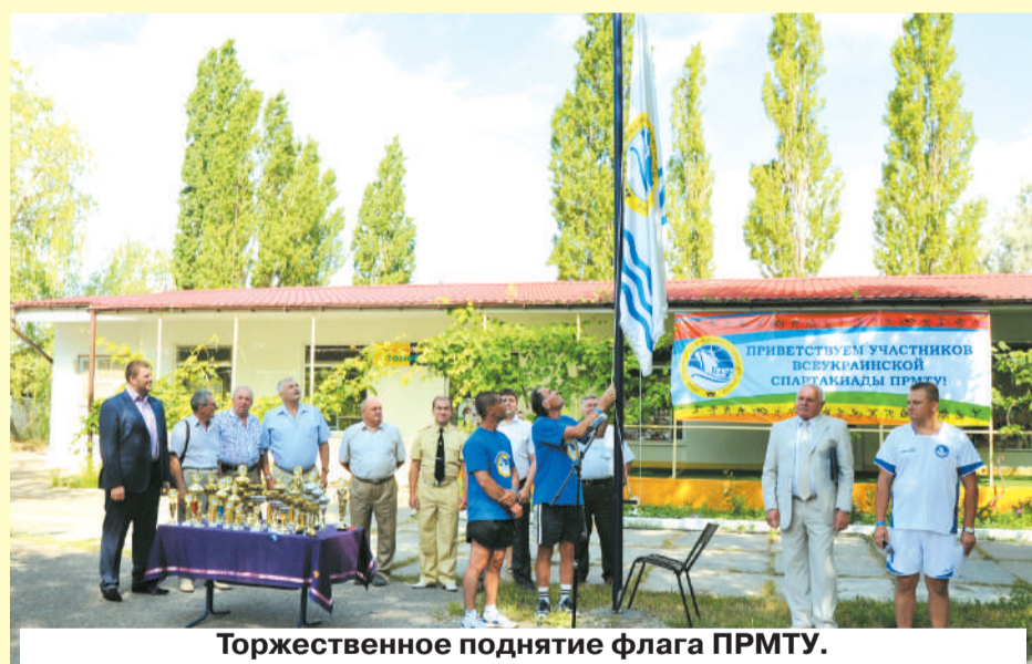
Торжественное поднятие флага ПРМТУ.

В Спартакиаде приняли участие 95 человек-членов Профсоюза, которые представили 11 предприятий, организаций и учреждений морского транспорта Украины. Помимо непосредственных участников соревнований, в мероприятии приняли участие председатели первичных профсоюзных органи-