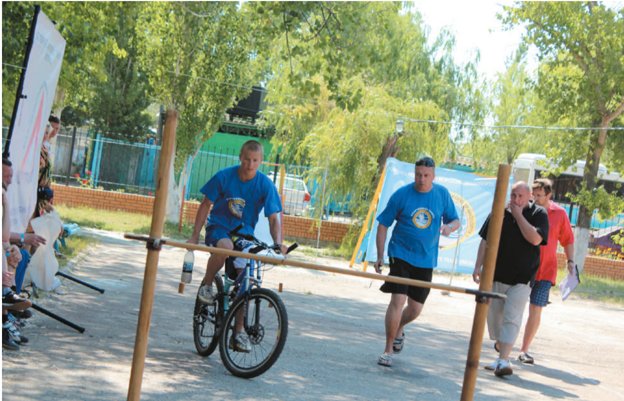
Соревнование по велотуризму вызвало интерес не только у участников, но и у болельщиков.

гового порта принимала участие и молодежь, и ветераны предприятия.