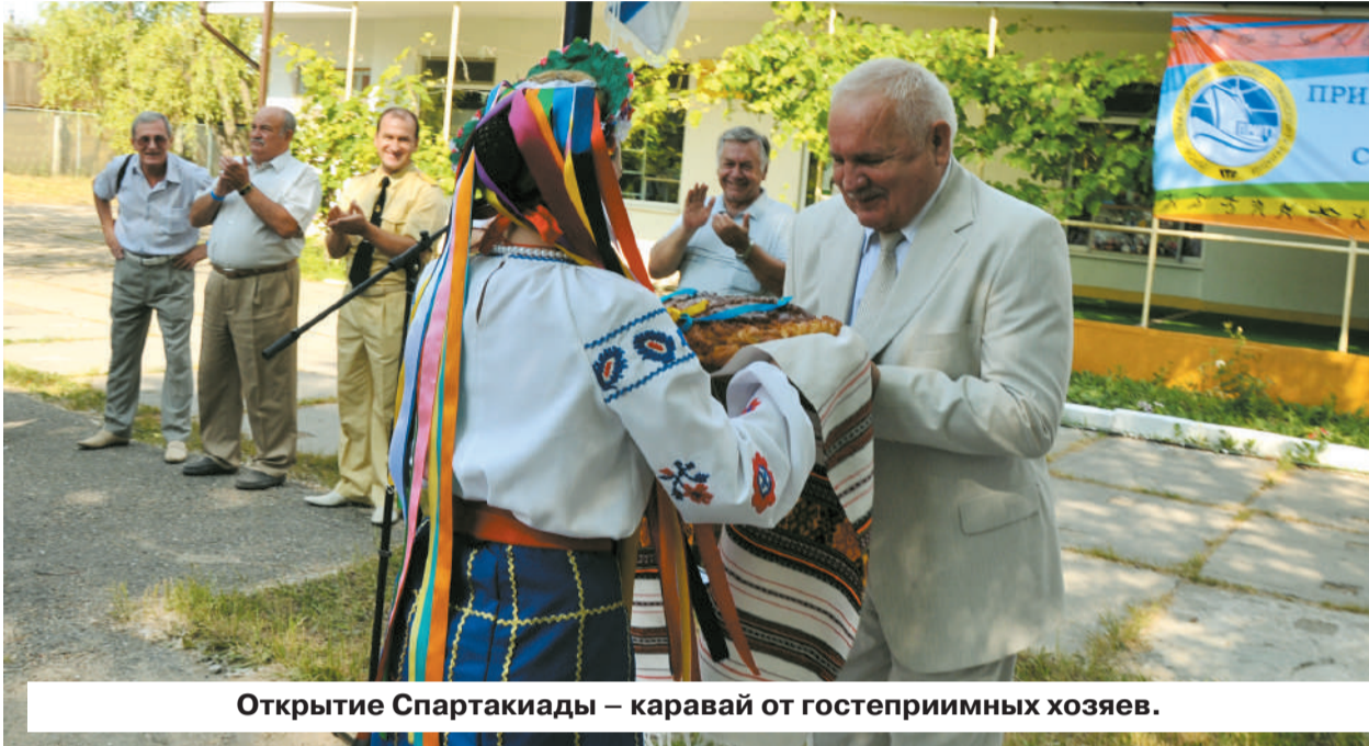
Открытие Спартакиады – каравай от гостеприимных хозяев.