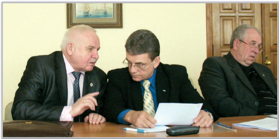
Председатель ФПУ Юрий Кулик: